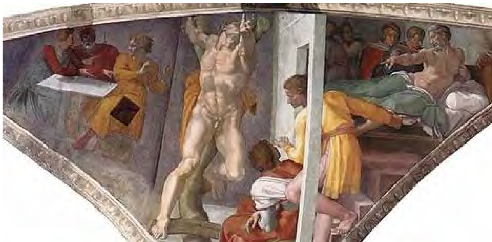
Punizione di Aman, Cappella Sistina (n.46) 1511-12