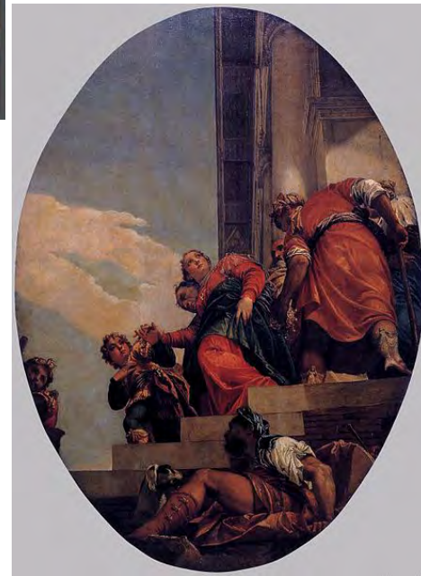
Ripudio di Vashti

Paolo Veronese (1528-1588) – Chiesa di Sebastiano a Venezia (1555-1556)