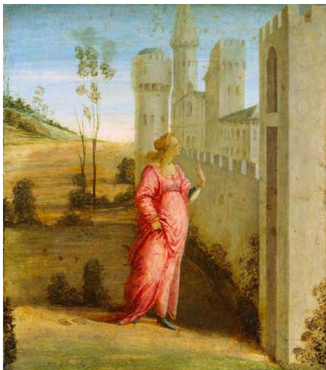
Botticelli e Filippino Lippi – La scelta di Esther (1475- 1480)