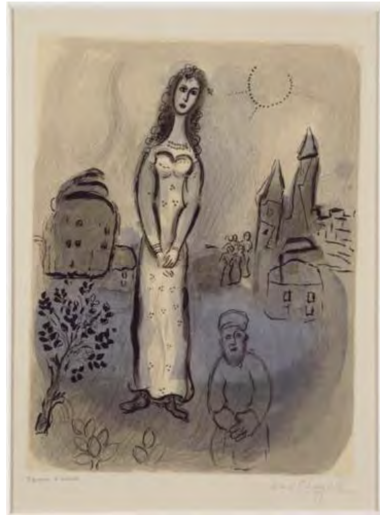
Chagall – Esther (1960)