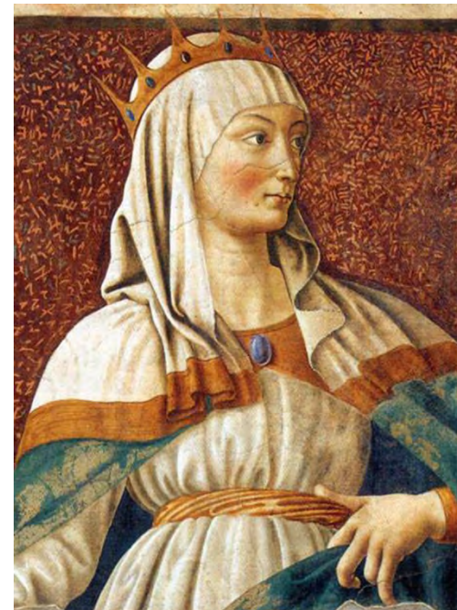
Andrea del Castagno Esther (1450)