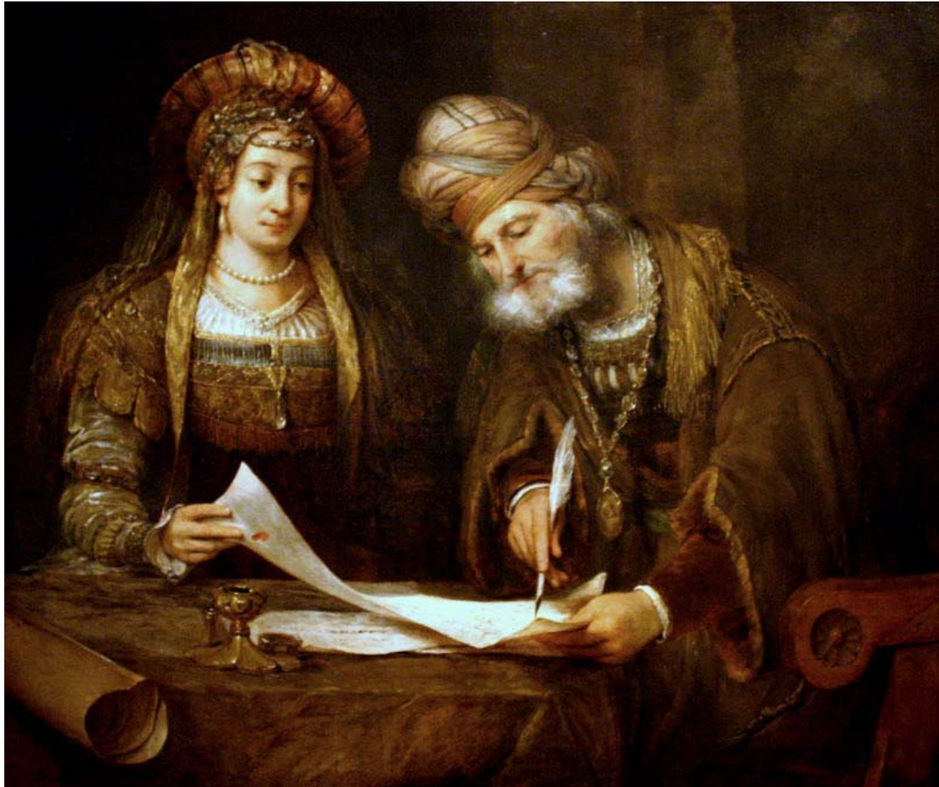
Aert de Gelder - Esther et Mordechai écrivant les lettres aux juifs (1675)