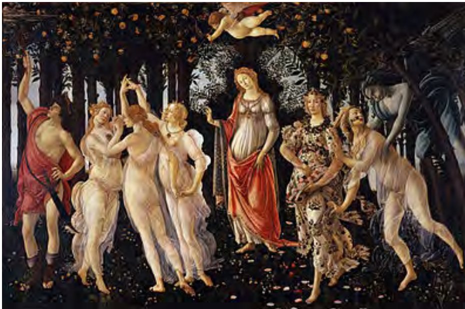
Botticelli – Primavera (1482)