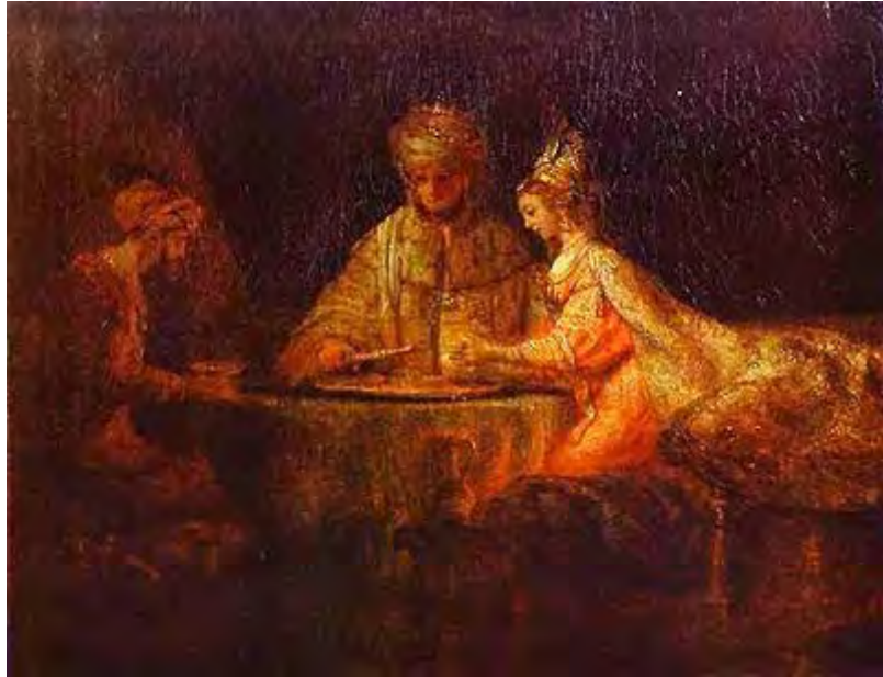
Aman (a sinistra), Assuero ed Esther al banchetto (1660)