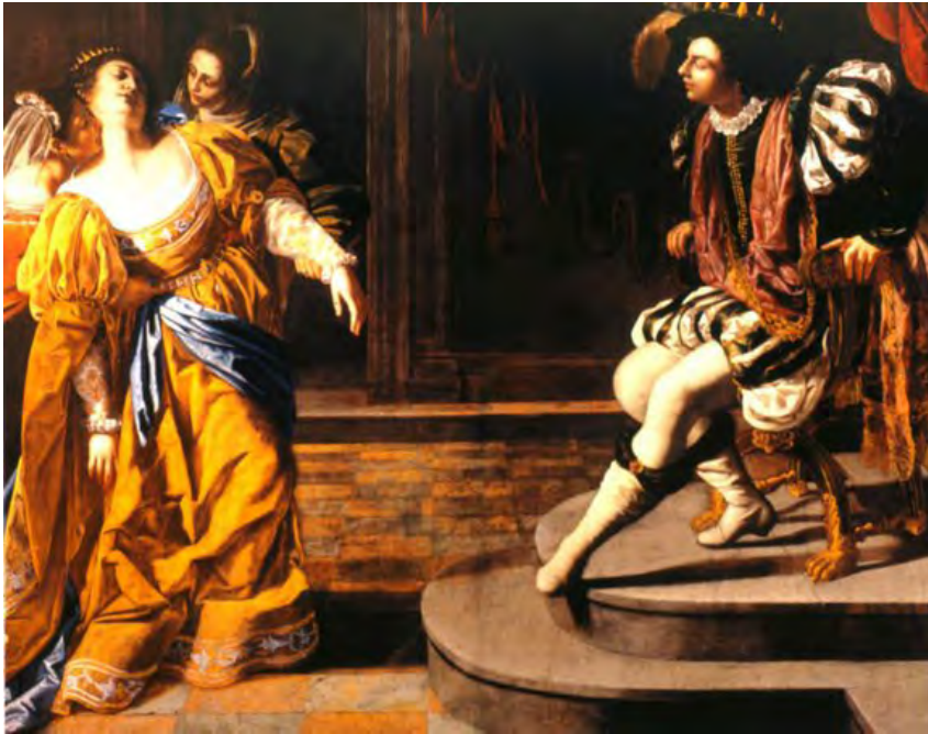
Tintoretto— Esther sviene davanti ad Assuero (1546-7)