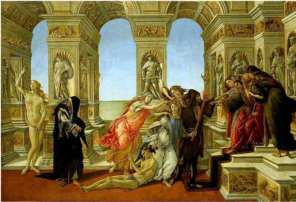
Botticelli – Calunnia (1495)