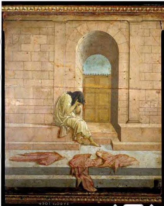
Botticelli e Filippino Lippi – Storie di Mordechai (1475-1480)