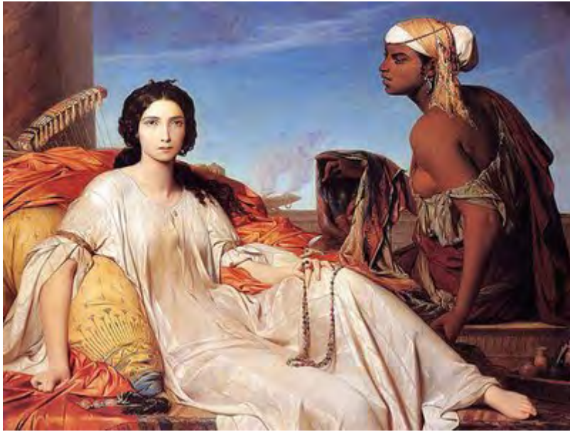
Louis Benouville- Esther (1844)