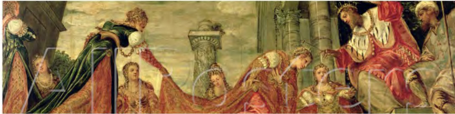
Tintoretto – Esther Assuero e Haman