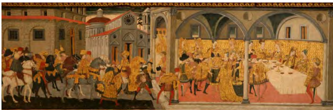
Marco del Buono Giamberti; Apollonio di Giovanni di Tomaso: La storia di Esther (1460–70)