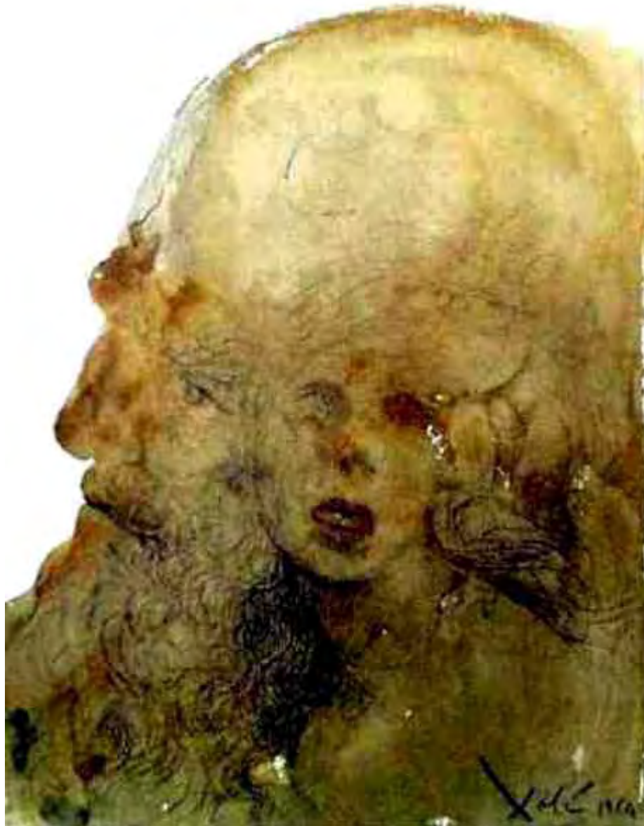
Dalí – Assuero si innamora di Esther (1964)