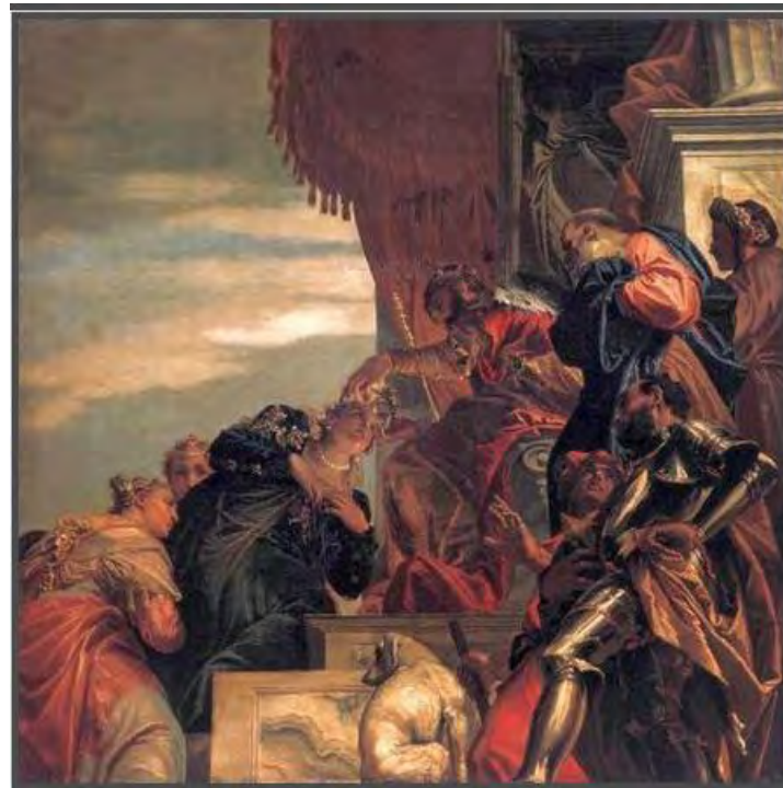
Incoronazione di Esther

Paolo Veronese (1528-1588) – Chiesa di Sebastiano a Venezia (1555-1556)