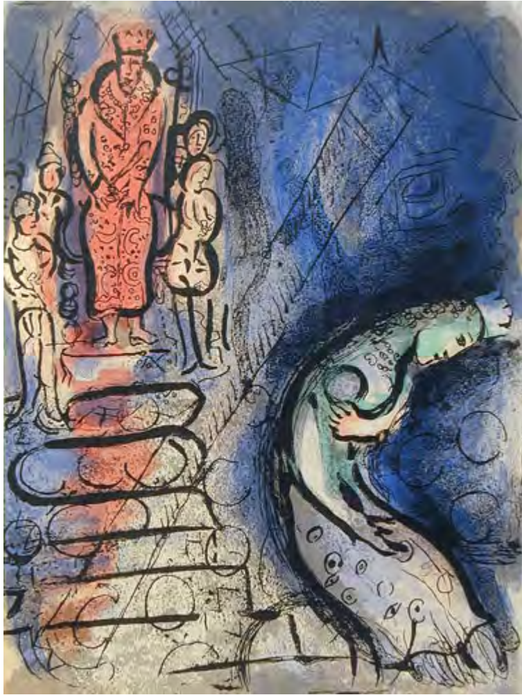
Chagall – Assuero allontana Vashti (1960)