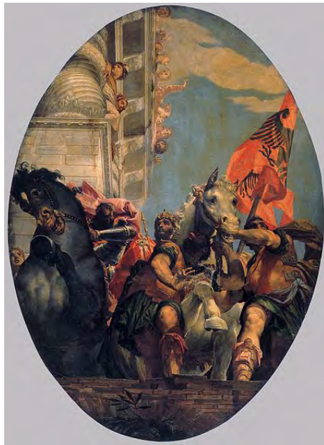
Trionfo di Mordechai