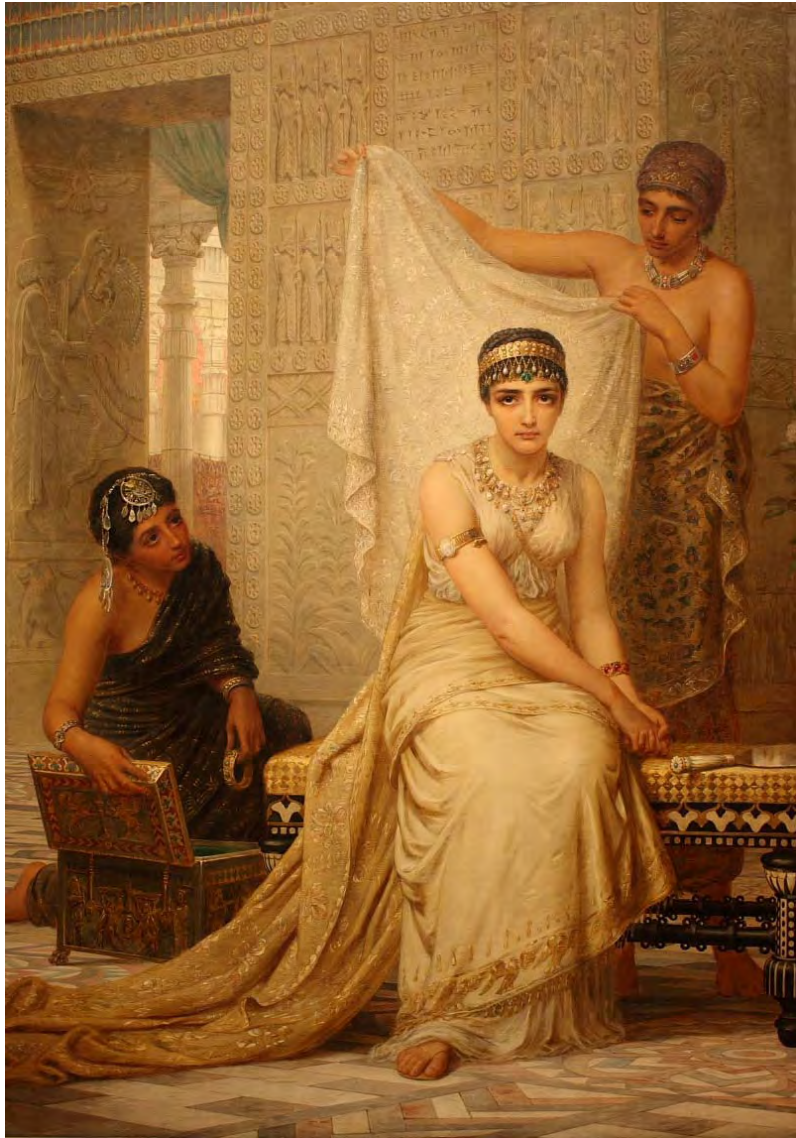
Edwin Long - la toeletta di Esther (1878)