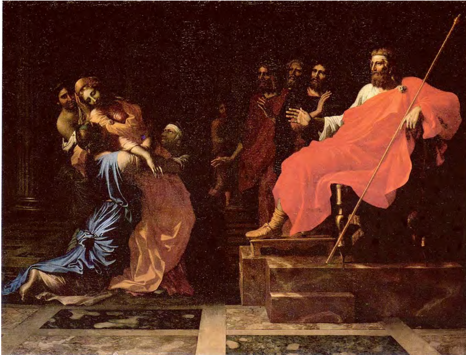
Claude Poussin – Esther sviene davanti ad Assuero (1640)