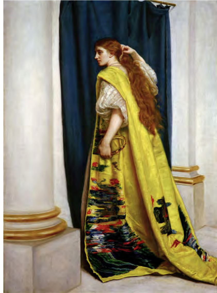
J. E. Millais - Esther (1865)