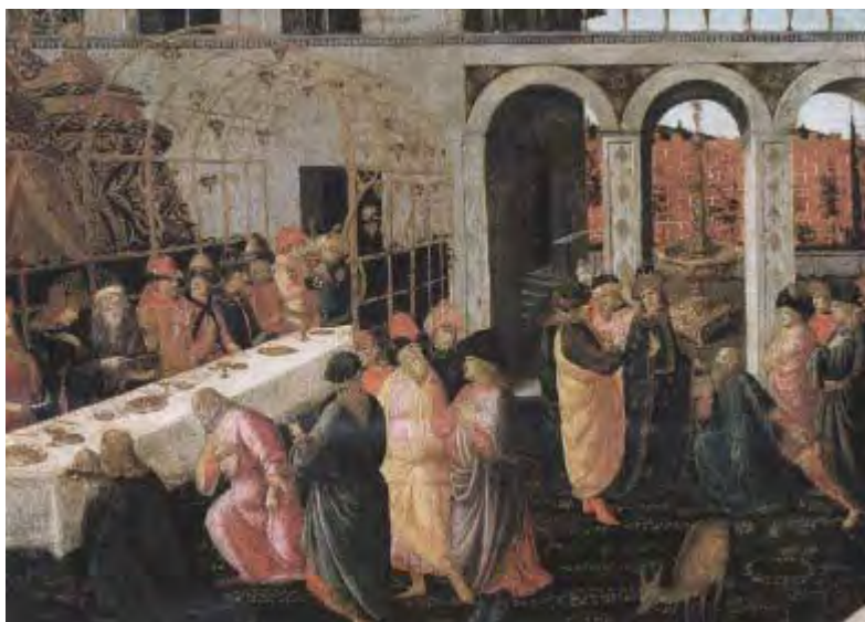
Jacopo del Sellaio – Storie di Esther (1485)